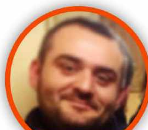
ROBERTO ZOLLO SCUOLA PRIMARIA