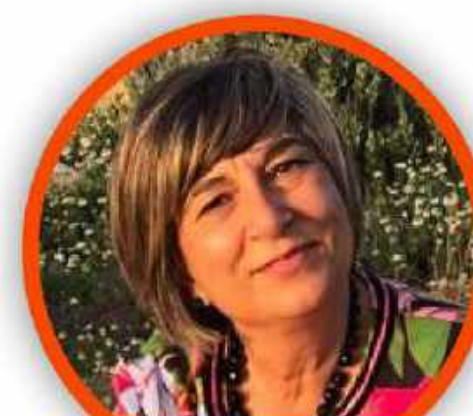
GIOVANNA MARIA BURRELLI SCUOLA PRIMARIA