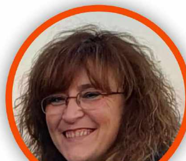
MARIANGELA MAPELLI SCUOLA PRIMARIA